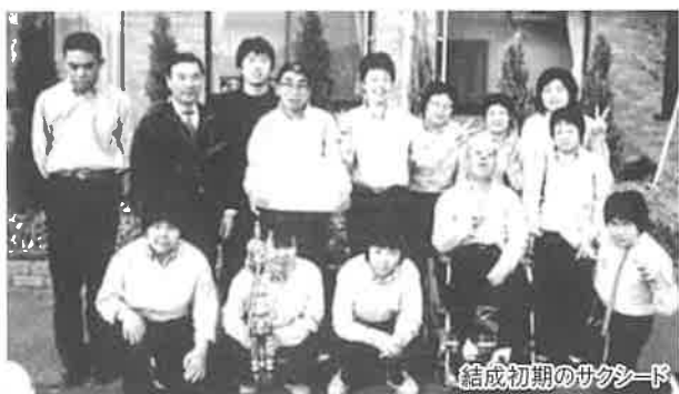
結成初期のサクシード

メンバーの交代はありましたが、様々な職員が寸暇を惜しんで携わり、代表曲も増え、その伝統を今日に引き継いでいます。みんな楽しいのが大好き。音楽が大好き。お声を掛けて下さい。どこへでも出張して素晴らしい演奏をお聞かせします。お待ちしております。